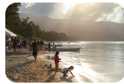
水遊びや舟漕ぎ競争で 親睦が深まる浜下れ (ニシ海岸側)