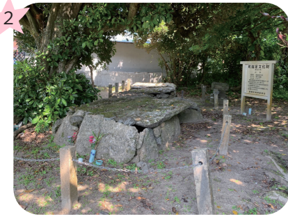
町指定文化財 ハヤ