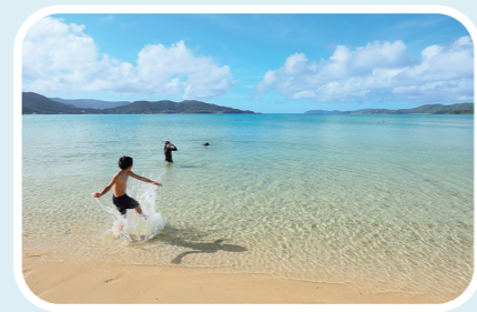
ニシ海岸で遊ぶ子どもたち

北と南の海に挟まれている特徴的な地形だよ。 片方の海が荒れているときは舟が出せないで、 もう片方の海岸まで皆で舟を運んだんだ。舟を運ぶた めの「舟引き道」は40年程前まで使われていたよ。