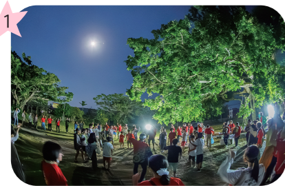
教会の大きなガジュマルの下 八月踊りを楽しむ種下ろし