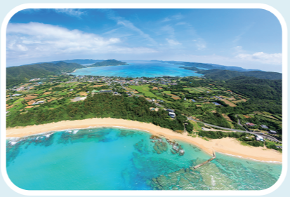
ニシ (北側) とヒガシ (南側) の海岸に挟まれた地形